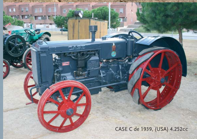
CASE C de 1939, (USA) 4.252cc