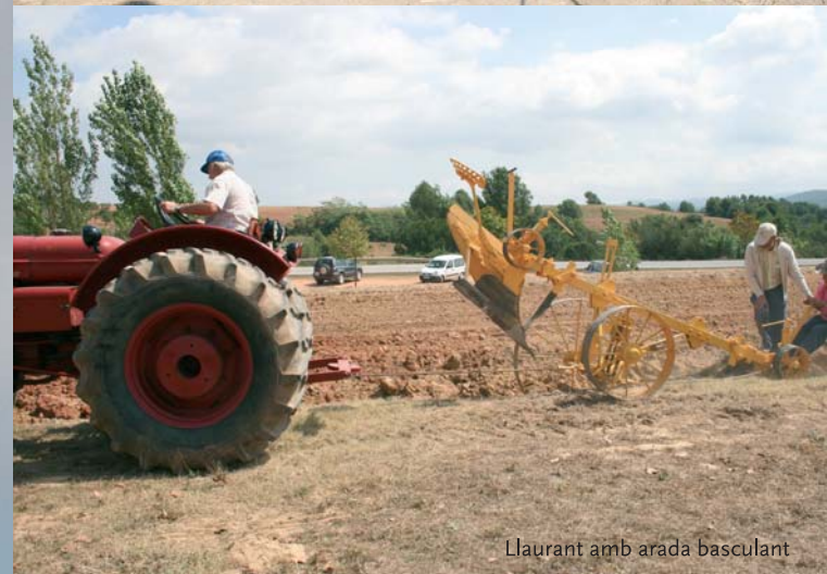
Llaurant amb arada basculant