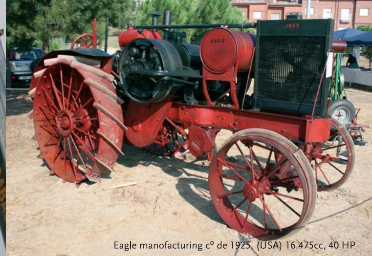
Eagle manufacturing cº de 1925, (USA) 16.475cc, 40 HP